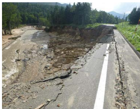
8月からの台風（7号、9号、11号）による被災状況※