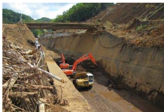
北海道胆振東部地震による厚真ダムの被災および復旧状況 ※